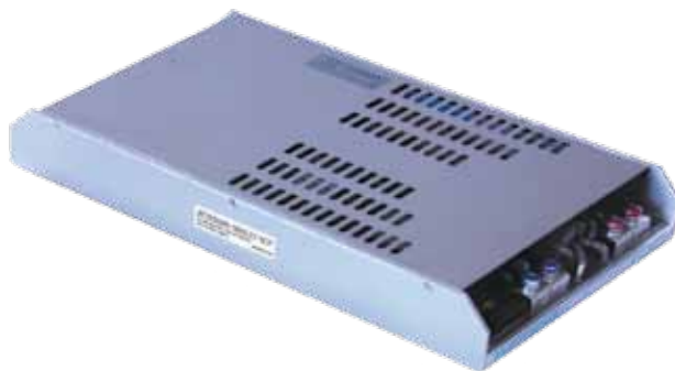
Рис. 3. Инновационный для российской техники высокоэффективный планарный AC/DC-модуль JETA3000-5000 с КПД выше 92% – основа для построения централизованных преобразователей матричных систем электропитания

Замечательным свойством рассматриваемого модуля является его планарность – профиль всей серии этих модулей (JETA2000, JETA3000, JETA5000) беспрецедентно мал – всего 38 мм; при этом можно утопить модули в тело радиатора еще на 6 мм. В таком случае они будут выступать над базовой плитой радиатора на высоту не более 32 мм! Другие подробности этой уникальной конструкции см. на [4].