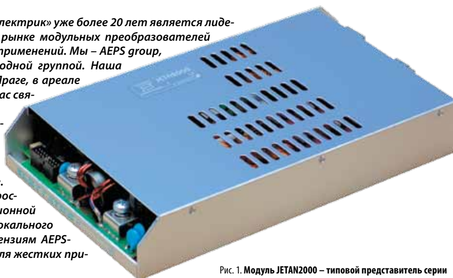
Рис. 1. Модуль JETAN2000 – типовой представитель серии

Группа компаний «Александр Электрик» уже более 20 лет является лидером инноваций на российском рынке модульных преобразователей электропитания для жестких применений. Мы – AEPS group, потому что стали международной группой. Наша штаб-квартира находится в Праге, в ареале знаменитой TESLA, с которой нас связывает многолетняя дружба. В 2015 г. мы закончили сотрудничество с российской фирмой ООО «АЕДОН» и открыли новый бизнес, создав ООО «ТЕ» и «ВИП АГ» в Москве и Воронеже. Стратегическая цель нашей российской половины – Инновационной группы ВИП АГ – организация локального производства в России по лицензиям AEPS-group и акредитация изделий для жестких применений.